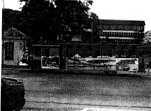
Cc Concejo Deliberante. Munic. de Ushuaia.