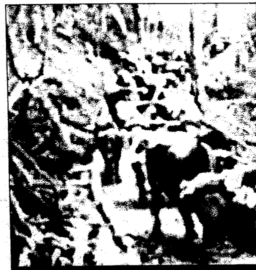
Con grandes dificultades se concretaba el traslado de ros del bosque fueguino

La a notable rradero; frances habían gran es quebró