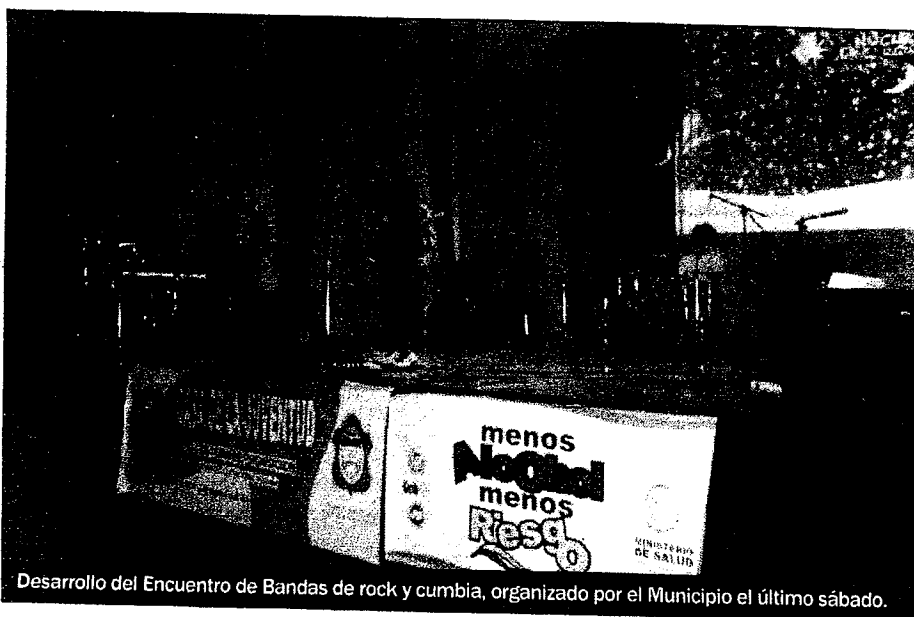
Desarrollo del Encuentro de Bandas de rock y cumbia, organizado por el Municipio el último sábado.

iva apunta a “sensibilizar a los adultos y jóvenes y apela ante el Encuentro de Bandas de rock y cumbia, del último ‘a jóvenes a usar las remeras con el logo de la campaña”, aje y marquen la diferencia”.