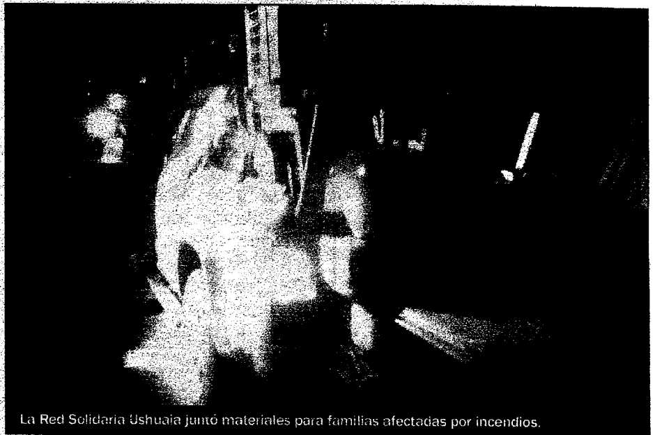
La Red Solidaria Ushuaia juntó materiales para familias afectadas por incendios.

Vecinos de la capital fueguina colaboraron para reunir el material para ayudar a vecinos damnificados por incendios ocurridos este mes.