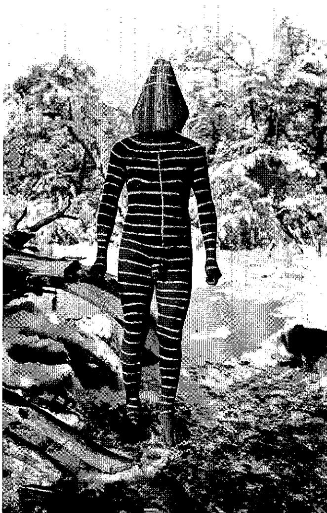
Ulen, el bufón masculino, Ceremonia del Hain, rito selk'nam, 1920, Fotografía de Martin Gusinde ©Martin Gusinde / Anthropos Institut / Éditions Xavier Barral