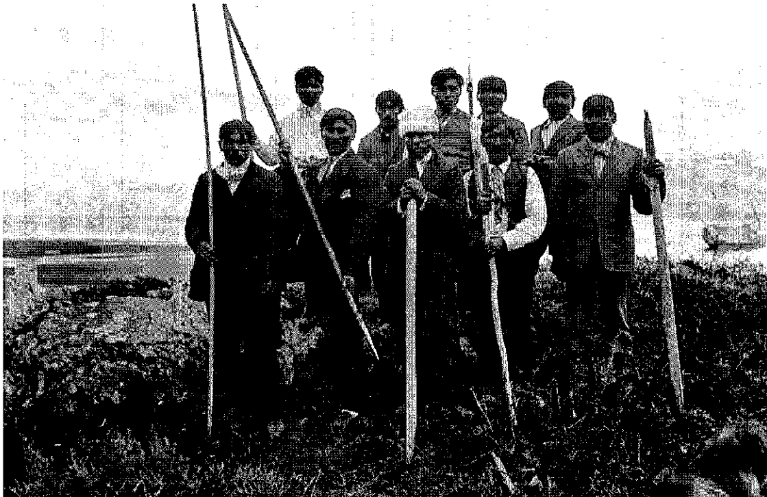
Arpones con punta de huesos destinados a la caza de leones marinos, delfines y pájaros marinos. Pueblo Yanama.