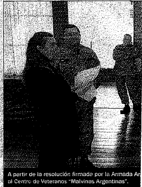
A partir de la resolución firmada por la Armada Argentina al Centro de Veteranos “Malvinas Argentinas”.