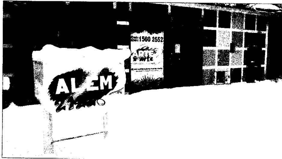
Vista desde el interior del local (vehículos de vecinos estacionados por varios días interrumpiendo la debida limpieza para un mejor ascenso/descenso de alumnos)