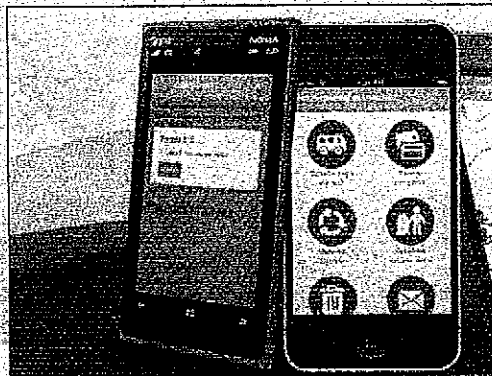
La nueva versión de la aplicación incorpora servicios

La aplicación había comenzado el año pasado con el horario de llegada de los colectivos a las distintas paradas a través del sistema "Cuándo llega". Actualmente está disponible la versión 2.0 con importantes mejoras y más servicios que la Municipalidad pone a