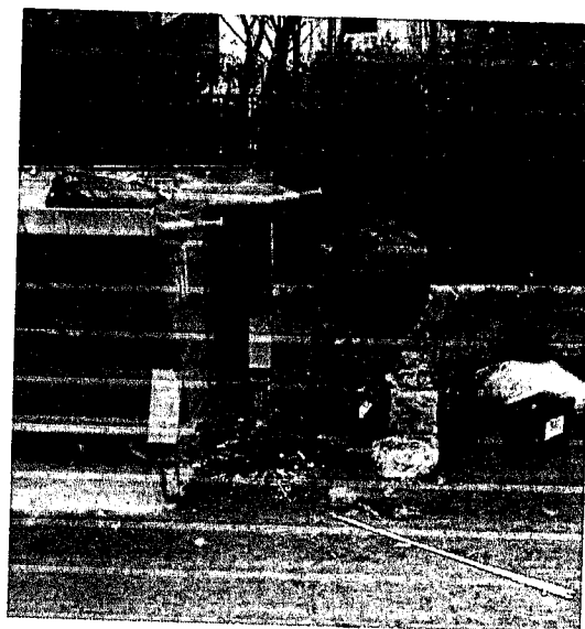
Calle Padre Mujica al 2800/2900