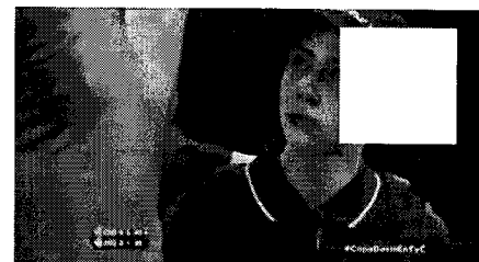
ACCIDENTE Y UN GESTO DEPORTIVO