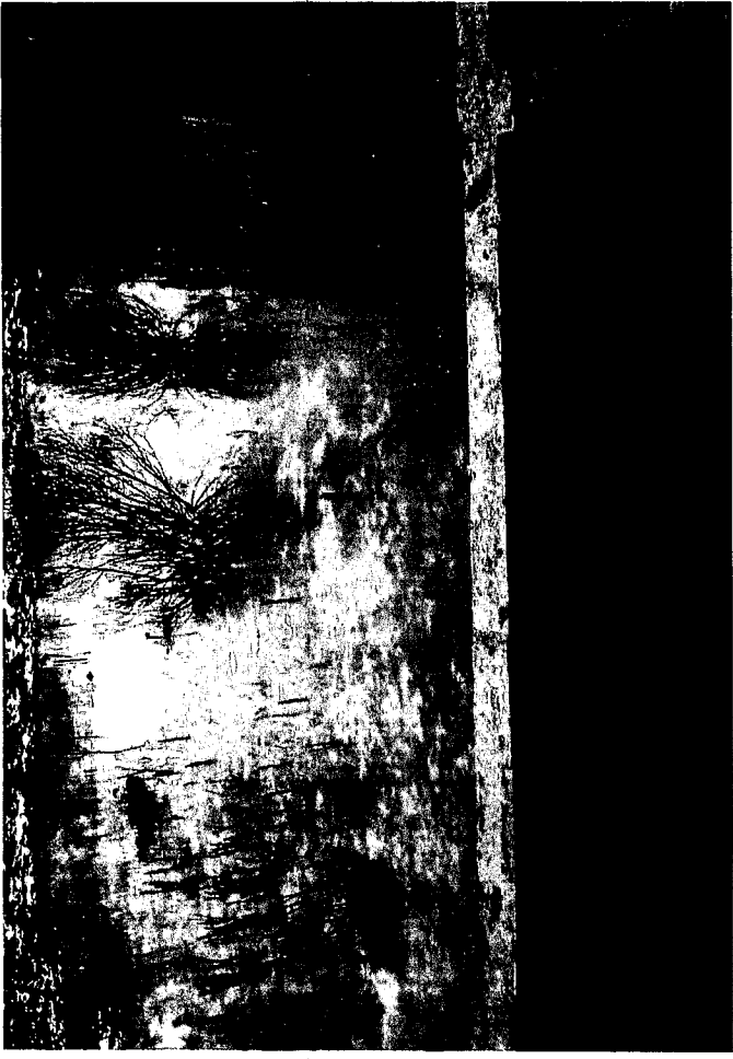
TERRENO BALDIO >> SOBRE BAHIA CAMBACERES Y SUBCOMISARIO MEDINA > BARRIO ALTOS DE MIRADOR