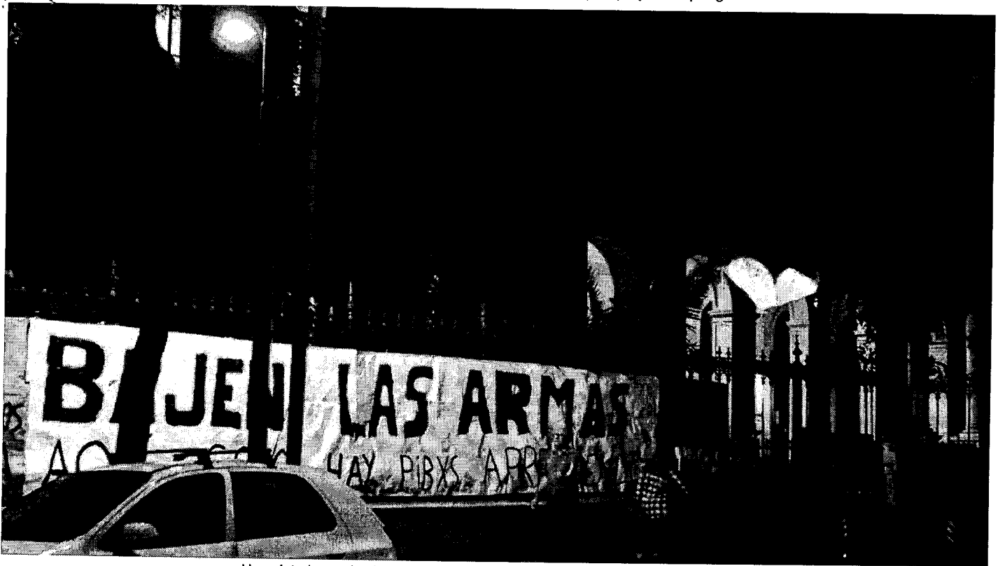
Una pintada en el colegio Mariano Acosta en contra de los abusos policiales.