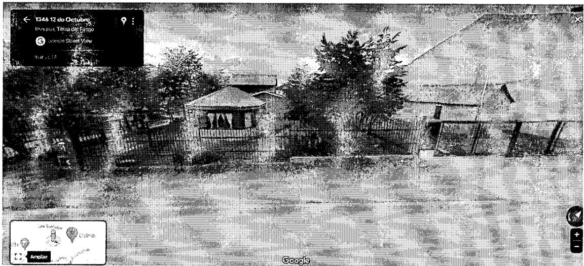
Garita en la calle 12 de Octubre esquina calle Catriel

Me dirijo a ustedes con el fin de solicitarles garitas de colectivos para la línea D y E que pasan por ahí, ya que cuando el clima es adverso la gente va a poder refugiarse a esperar dicho transporte, también les quiero contar que no hay ninguna señalización que indique que por ese lugar pasa por dicha calle y si sos nuevo o no conoces el barrio te podés perder fácilmente.