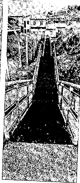
Macizos 17 y 18, calles IGNACIO RUCCI a RICARDO BALBÍN,