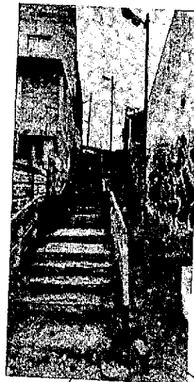
Macizos 13 y 14, calles RICARDO BALBÍN a FACUNDO QUIROGA.