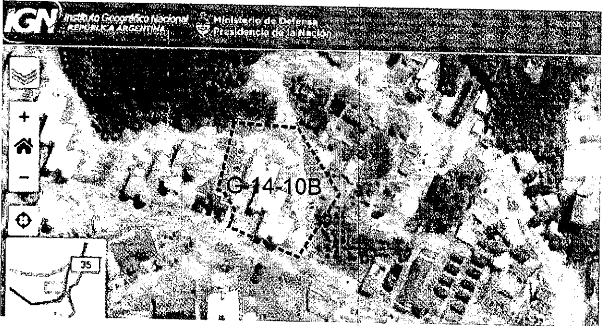
Imagen del Instituto Geográfico Nacional de la República Argentina

ANEXO II.----- RESOLUCIÓN CD N. 86 /2020